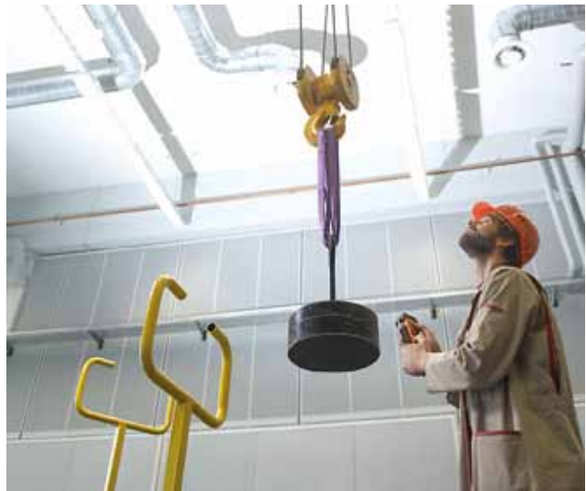
Bedienung des Krans in der Mehrzweckhalle