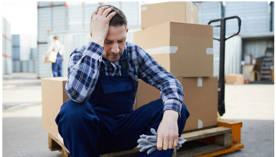
Psychische und körperliche Erkrankungen können entstehen, wenn die Belastung dauerhaft zu hoch ist.

Psychische Erkrankungen sind nie nur arbeitsbedingt, jedoch können eine gute Arbeitsorganisation und ein gutes Betriebsklima die Belastung reduzieren. Es ist wichtig, die verschiedenen Belastungen im Team zu identifizieren und ihnen entgegenzusteuern. „Faktoren wie Wertschätzung, Entscheidungsspielraum, mitarbeiterorientierte Führung, Kollegialität sowie Möglichkeiten zur Weiterentwicklung wirken sich nachweisbar positiv aus“,