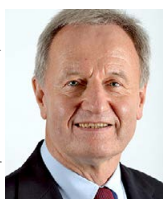
Friedhelm Julius Beucher Präsident des Deutschen Behindertensportverbands (DBS)