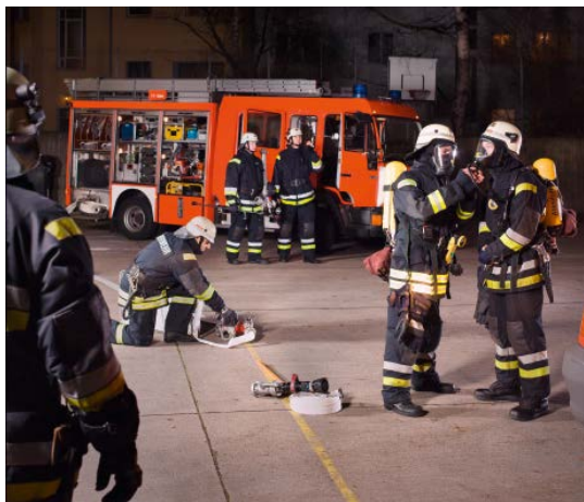
Abb. 1: Feuerwehren aber auch Hilfeleistungsorganisationen wie die Rettungsdienste, THW, Wasserrettung, Bergwacht etc. stellen eine sehr spezielle Sparte bei Sicherheit und Gesundheitsschutz dar. Ihre Tätigkeit birgt oft ein hohes Gefährdungspotential, das häufig die Benutzung von PSA erforderlich macht. Gerade der im Bild dargestellte Einsatz mit Pressluftatmern bei Gebäudebränden ist eine äußerst anspruchsvolle Tätigkeit.