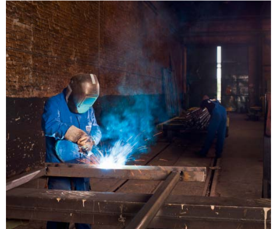
Abb. 2: Die Helligkeit, die Hitze und der Funkenschlag machen eine hochwertige Persönliche Schutzausrüstung beim Schweißen unerlässlich.

Regelungen zur Marktüberwachung finden sich in Kapitel VI. Im Rahmen der Bearbeitung im Europäischen Rat wurden Regelungen zur Marktüberwachung 2014 in den Entwurf der EU-Kommission eingefügt. Zusätzlich gelten nach Artikel 37 die dort genannten Inhalte der Verordnung 765/2008 [10] auch für PSA. Des Weiteren sind Artikel 38 „Verfahren zur Behandlung von PSA, mit denen ein Risiko verbunden ist, auf nationaler Ebene“, Artikel 39 „Schutzklauselverfahren der Union“, Artikel 40 „Risiko durch konforme PSA“ und Artikel 41 „Formale Nichtkonformität“ für Interessierte aufschlussreich. So kann