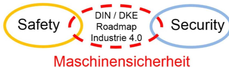
Abbildung 4: Mögliche Verbindung von Safety und Security über Maßnahmen aus der DIN/ DKE-Roadmap Industrie 4.0

Die Normungs-Roadmap ist als Orientierung für die Kommunikation zwischen Herstellern, Anwendern, Verbänden und auch Arbeitsschützern konzipiert. Ein neuer Abschnitt 5.9 „Der Mensch in der Industrie 4.0“ wurde unter Beteiligung von Anbietern, Anwendern, BAuA, Institut für Arbeitsschutz der DGUV und DIN Normenausschuss Ergonomie (NAErg) erstellt.