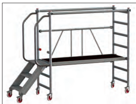
Abb. 8: Fahrbares Klappgerüst

Einsatz von Kleinsthubarbeitsbühnen führen. Da ist gerade in der Bauwirtschaft noch Luft nach oben, wie kürzlich eine interessante Veröffentlichung der Fa. Spie Deutschland und Zentraleuropa gezeigt hat (BauPortal 1/2019 „Effizienz trifft Arbeitssicherheit“, S. 16–17).