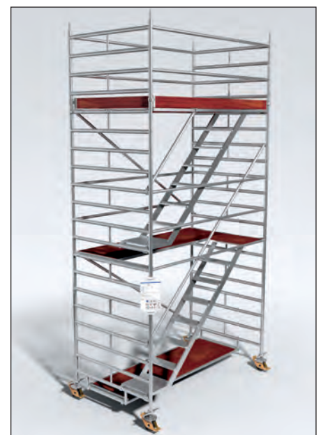
Abb. 9: Fahrbare Arbeitsbühne

Fahrbare Arbeitsbühnen (Abb. 9) können in vielen Fällen, oft im Innenausbau hallenartiger Bauwerke aber auch im Außenbereich mit geeignetem Untergrund, als sichere Steighilfe eingesetzt werden. Ein