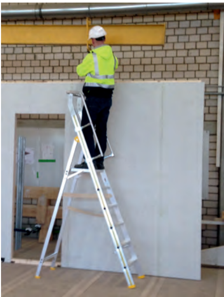
Abb. 10: Plattformleitern werden von der BG BAU als Arbeitsschutzprämie gefördert

ihre Gewichte kann ein Handlingproblem sein. Mit Hebezeugen lassen sich diese Leitern aber auch von Etage zu Etage transportieren. Einseitig angebrachte Fahrrollen erleichtern dann den horizontalen Transport der Leiter. Die Podestleiter ist also eine Steighilfe für einige bestimmte Einsatzbereiche mit eher vorhersehbaren Bedingungen.