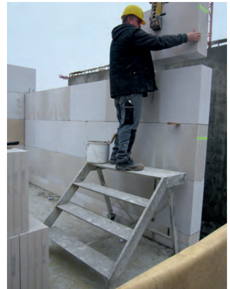
Abb. 7: Podesttreppe

im Hochbau zu finden (Abb. 7). Dort werden sie oft für das Versetzen von großformatigen Steinblöcken verwendet und ersetzen das lange Zeit gepflegte Bockgerüst. Tritte können aber auch in vielen anderen Gewerken sowie in stationären Betriebsteil, z.B. in der Werkstatt oder im Lager, sinnvoll eingesetzt werden.