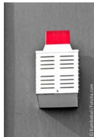
Abb. 7 Optisches und akustisches Signal