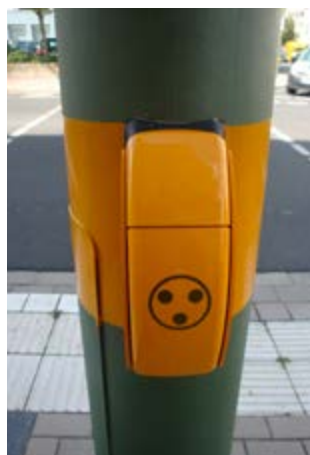
Abb. 6 Akustisches und haptisches Signal

Dabei ist es wichtig zu erkennen, dass mit dem Zwei-Sinne-Prinzip nicht alle Menschen Berücksichtigung finden (z.B. können bei auditiv-visuell angebotenen Informationen taub-blinde Personen die Information nicht wahrnehmen).