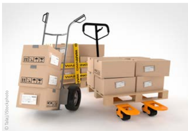
Abb. 4 Sackkarre und Hubwagen mit Büromaterial