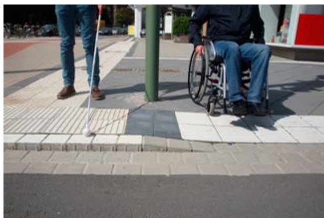
Abb. 8 Taktile und optische Erkennbarkeit