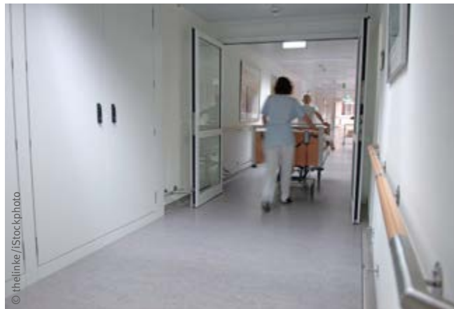
Abb. 2 Ausreichende Türbreiten