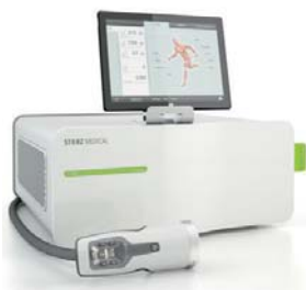
DUOLITH® SD1 T-TOP »F-SW ultra«