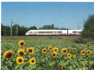
Claus Weber/DB AG