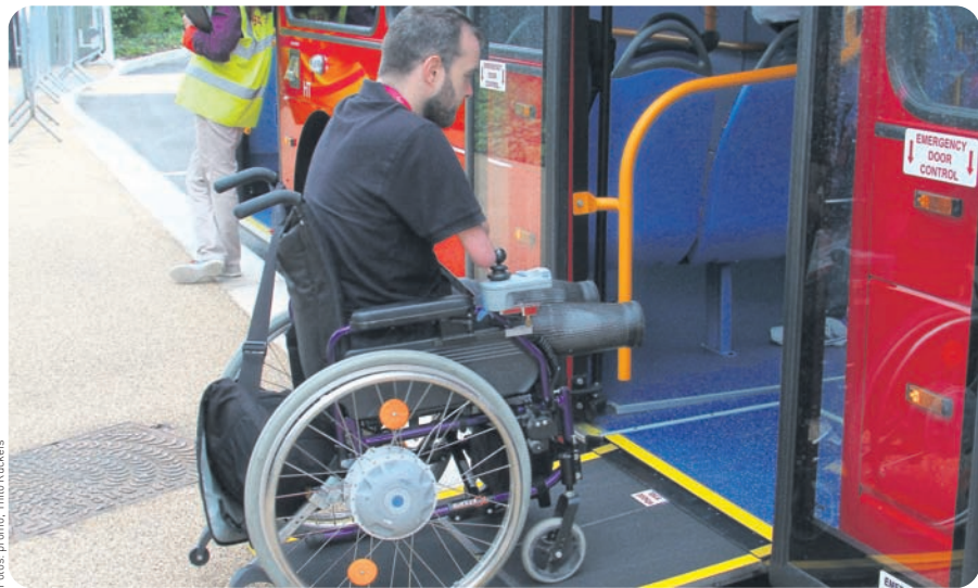
Alles klar auf der Bahn. Im Velodrom gab es nach den Olympischen Spielen wenig Umbaubedarf. Auf behindertengerechten Transport musste natürlich geachtet werden.