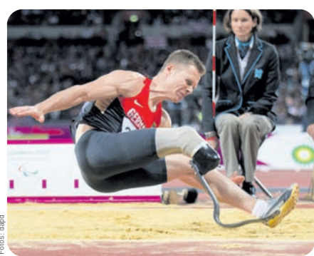
Weitspringer Markus Rehm hat mit Weltrekord Gold gewonnen. Springt er bald bei Wettkämpfen der Nichtbehinderten?