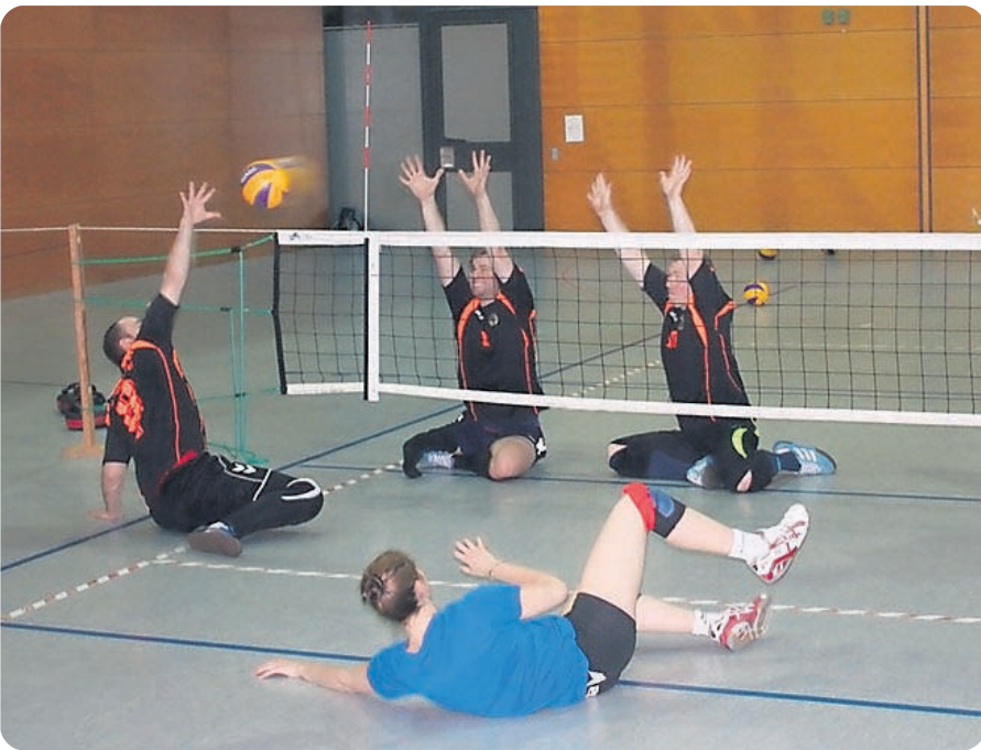
Umgefallen. Beim Sitzvolleyball die Haltung zu bewahren, ist gar nicht leicht.

Unsere Autorin ist seit zehn Jahren Volleyballerin . Nun spielte sie ihren Sport erstmals im Sitzen. Ein Selbstversuch mit Hindernissen