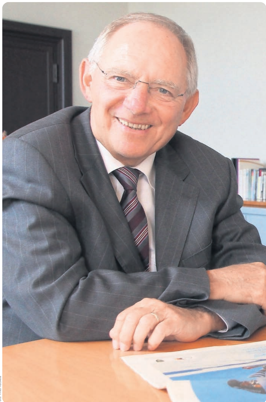
Finanzminister Wolfgang Schäuble kennt sich bei den Paralympics bestens aus.

Ich weiß nicht, ob ich ein Paradebeispiel bin, aber in meiner politischen Tätigkeit spielt die Tatsache, dass ich behindert bin, keine Rolle. Ich bin deswegen kein besserer Politiker, aber auch kein schlechterer. Unter Menschen bei einem Empfang oder einer Party beispielsweise tue ich mich manchmal schwer. Wenn alle stehen, dann bist du als Rollstuhlfahrer blöd dran.