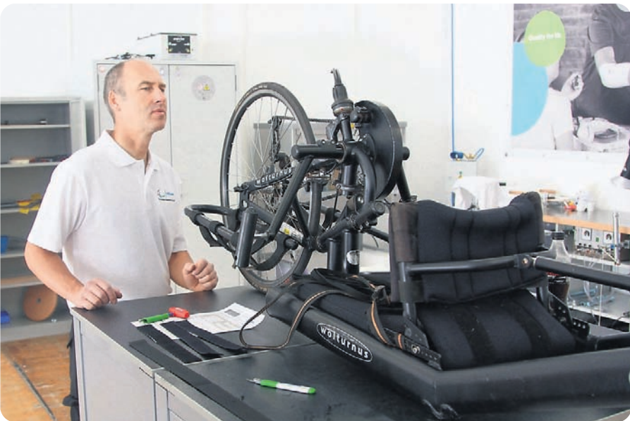
Ein Techniker von Ottobock repariert im Paralympischen Dorf ein Sportgerät.

Die Herstellung von Sportprothesen hat sich in den vergangenen Jahren rasant entwickelt. Viele Firmen sind in London dabei, um die Athleten zu unterstützen