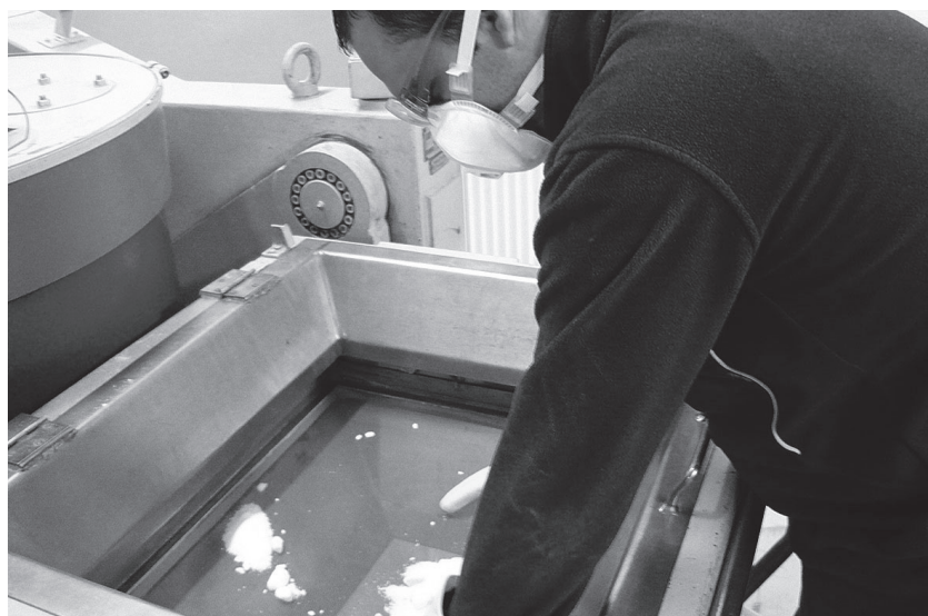
Bild 1. Sieben von Naphthalin in der Schleifmittelproduktion.

herstellung durchgeführt, weil in diesem industriellen Bereich weitgehend offen mit Naphthalin umgegangen wird (Bild 1) und es keine wesentlich anderen Expositionen gegenüber Stoffen mit potenziell irritativer Wirkung auf die Atemwege gibt.