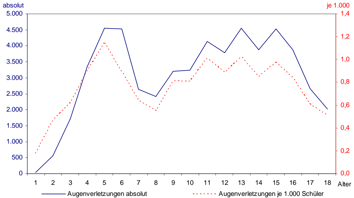
Abbildung 2 Augenverletzungen im Schulsport 2003 - 2007 (absolut und je 1.000 Schüler) nach Alter