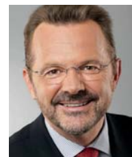
Franz Thönnies, Parlamentarischer Staatssekretär im Bundesministerium für Arbeit und Soziales

Gesetz zur Modernisierung der gesetzlichen Unfallversicherung sind die Weichen gestellt, um Berufsgenossenschaften und Unfallkassen zukunftsfest zu machen.