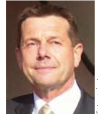
Dr. Franz Terwey

einräumt. Insoweit könnten die in der gesetzlichen Unfallversicherung vorgesehenen besonderen Anforderungen an die am Heilverfahren beteiligten Ärzte oder Krankenhäuser als eine Einschränkung der vorgesehenen freien Arztwahl gewertet werden.