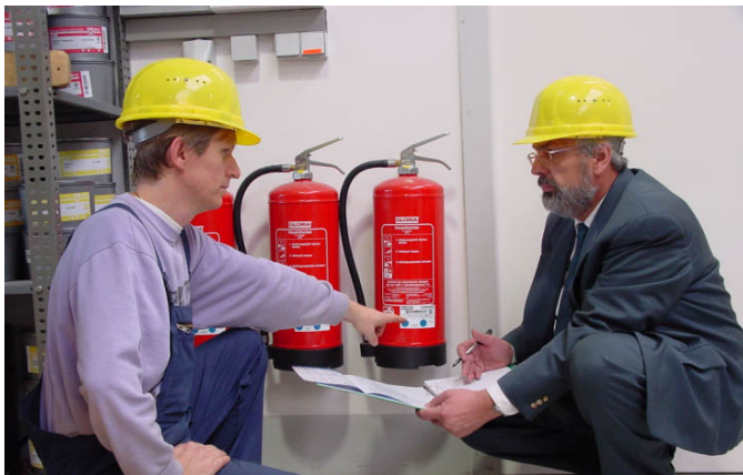
Unternehmer "im Einsatz"

Der sicherheitstechnischen Betreuung von Kleinbetrieben kommt höchste Bedeutung zu. Die Praxis hat gezeigt, dass hier in der Regel Tätigkeiten des Einzelnen, anders als in Großbetrieben, weniger arbeitsteilig sind. Auch das Wissen um Gefährdungen und Belastungen ist in Kleinbetrieben oft geringer als in Großbetrieben. Dementsprechend liegen in den meisten Branchen die Unfallzahlen in kleinen Unternehmen deutlich höher.