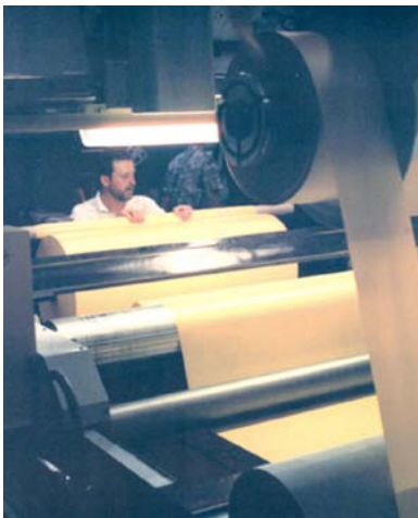
Herstellung von Bahnenware

Die Lederindustrie-Berufsgenossenschaft hat in den letzten zehn Jahren im Rahmen einer umfassenden Präventionsinitiative Unternehmer und Führungskräfte der Bahnenwarehersteller für Arbeits- und Gesundheitsschutz bis hin zur Einführung eines Arbeitsschutzmanagementsystems sensibilisiert und motiviert. In Zusammenarbeit mit externen Unternehmensberatern, die sich auf das Gebiet der Arbeitspsychologie spezialisiert haben, wurde ein Prozess zur Steigerung des Sicherheitsbewusstseins unter Einbeziehung eines effektiven Arbeitsschutzmanagementsystems eingeleitet, das heißt Visionen beziehungsweise Ziele und deren Kommunikation, Organisation und Verantwortung, Umsetzungsmaßnahmen und Auditierung.