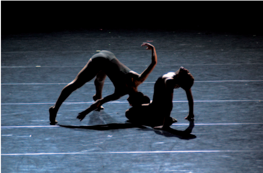
Abbildung 8: Choreografisch bedingte dunkle Beleuchtung