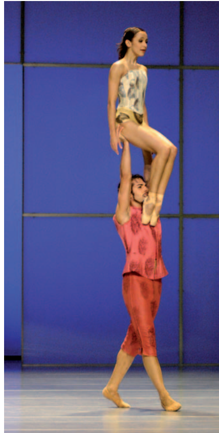
Abbildung 11: Hebung

Empfohlen wird ein Personalschlüssel von ca. 1 : 30 (in Anlehnung an die Rahmenempfehlungen zur Rehabilitation von muskuloskeletalen Erkrankungen, 2005). Sollten zusätzlich therapeutische Maßnahmen erbracht werden, die mit einem erhöhten Zeitaufwand einhergehen, verschiebt sich der Personalschlüssel entsprechend.