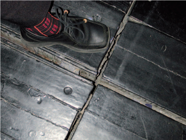
Abbildung 2: Holzfußboden einer multifunktionalen Bühne mit Bühnenwagenschiene und Spalten

Grundsätzlich sollten diese Stellen durch die Choreografie ausgespart bleiben.