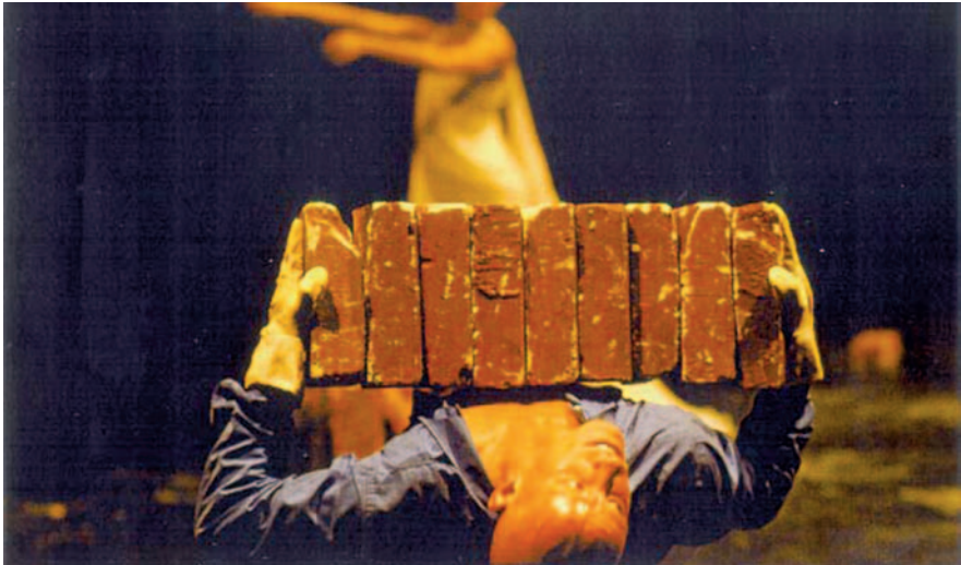
Abbildungen 3 und 4: Requisiten im Tanz (Steine und Messer)