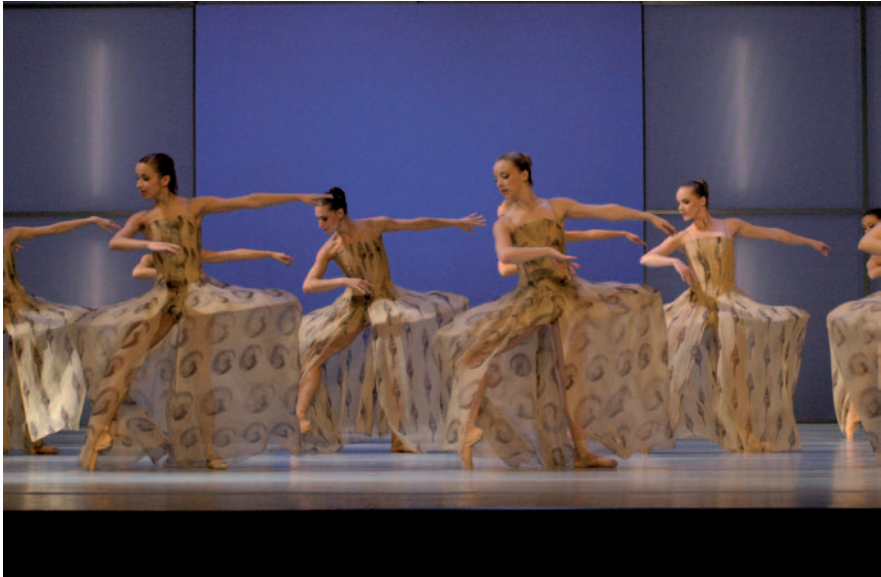
Abbildung 6: Verletzungspräventiver Aspekt Kostümlänge