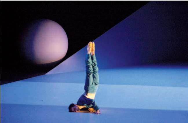
Abbildung 14: Akrobatische Bewegungsinhalte