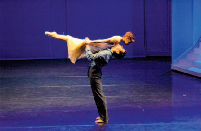
Abbildung 13: Beispiel für Bewegungsinhalte im Tanz – Hebung