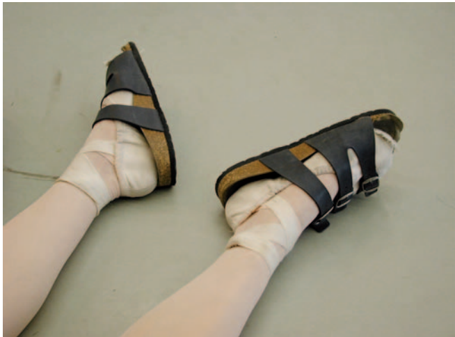
Abbildung 7: Nicht adäquates, Verletzungen begünstigendes Schuhwerk

Kulissen, Türen (vor allem schwere Sicherheitstüren), Treppen und Bühneneffekte sowie unzureichende Lichtverhältnisse stellen weitere Unfallgefahren dar (Abbildung 8). Da insbesondere eine schlechte Ausleuchtung auf der Bühne – choreografisch bedingt – nicht immer vermieden werden kann, ist hier eine ausreichende und frühzeitige Gewöhnung an die mit der jeweiligen Inszenierung verbundenen Besonderheiten unbedingt erforderlich.