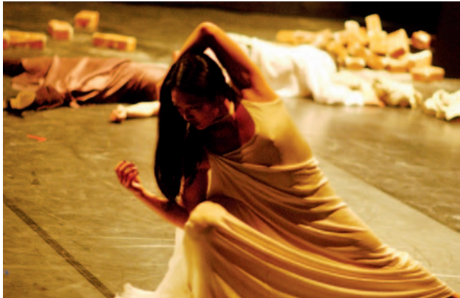
Abbildung 16: Erhöhte Unfallgefahr durch Requisiten/ Verunreinigungen auf der Bühne

er – bestehend aus einem Unterboden und Deckbelag – als Arbeitsmittel im Tanz betrachtet werden muss und neben einem/einer eventuellen Tanzpartner/ Tanzpartnerin den einzigen Halt bei Bewegungsabläufen im freien Raum darstellt. Bei optimaler Beschaffenheit und Zusammensetzung stellt er einen wichtigen Beitrag in der Verletzungsprophylaxe dar (Abbildung 16).