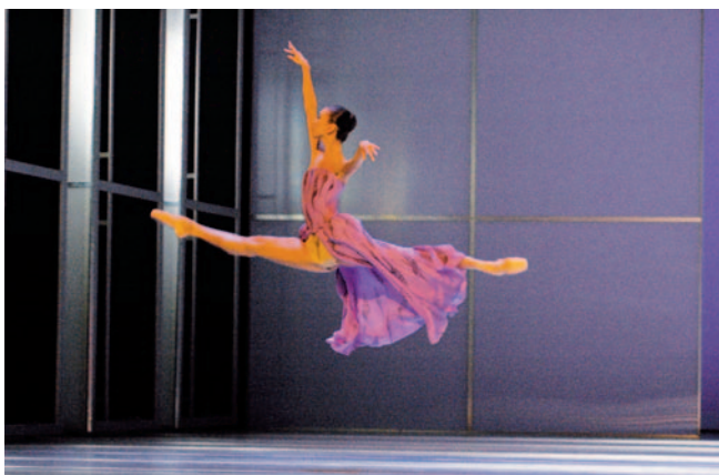
Abbildung 15: Grand-allegro-Sprung

An Einrichtungen mit wechselnden Inszenierungen im Verlauf einer Spielzeit und einer Frequenz von 50 bis 60 Vorstellungen pro Spielzeit, ereignen sich zwar immer noch fast ein Drittel aller Verlet-