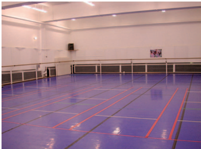
Abbildung 1: Ballettsaal mit Schräge und Deckbelag

Es muss darauf geachtet werden, dass die Lokalisation der Spalten und Schienen oder Ähnliches klar ist und falls eine Vermeidung nicht möglich ist, entsprechende Kennzeichnung erfolgt.