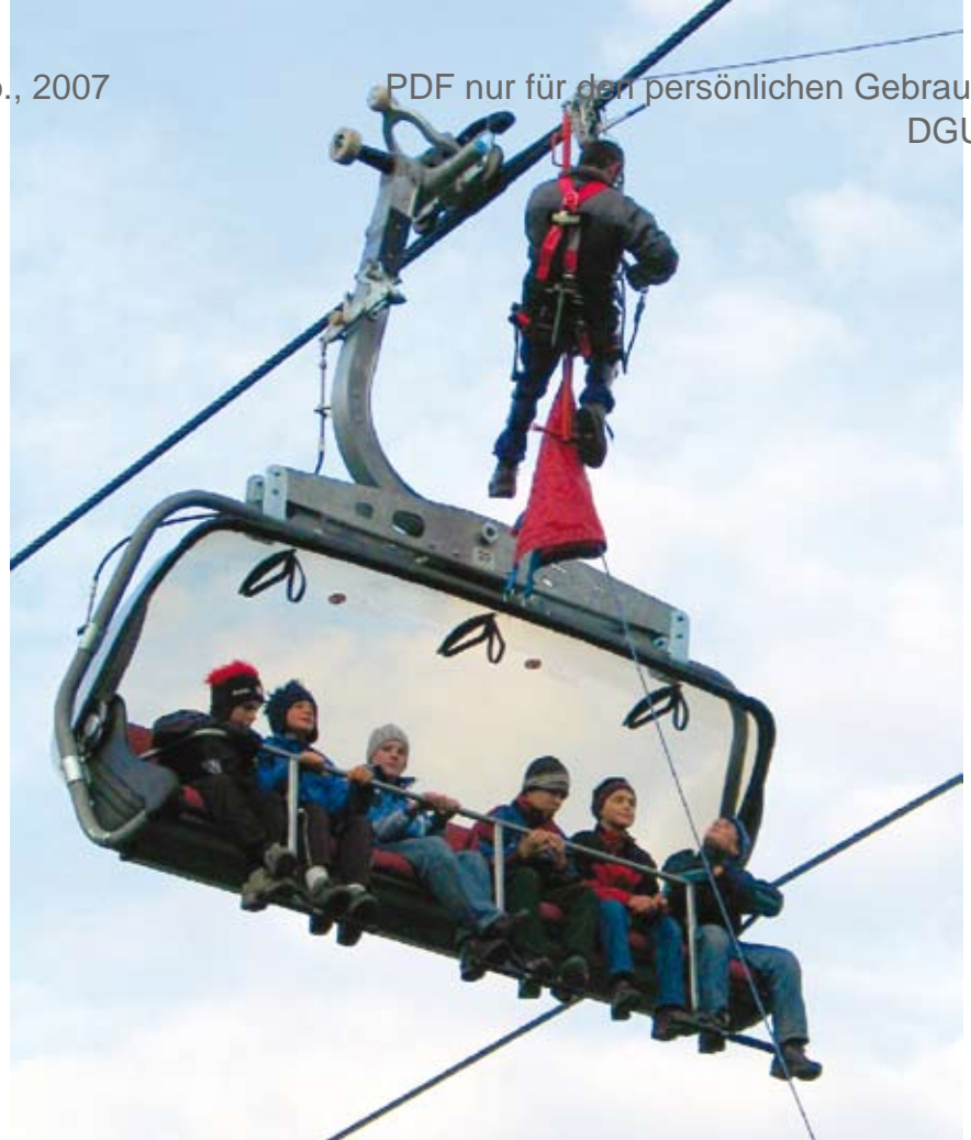
Abbildung 3: Gute Bergung für Fahrgäste und Bergehelfer

Aus den genannten Untersuchungsergebnissen und Präventionsvorschlägen heraus können Mindestanforderungen an Retter und Berger, die Seiltechnik einsetzen, formuliert werden. Hierzu gehören die Verbesserung der fachlichen Kompetenzen, die hohen Anforderungen an die Fitness (Beweglichkeit, Kraft und Ausdauer) und die zusätzliche Qualifizierung zum Umgang mit psychischen Belastungen, z. B. zum Umgang mit Panik, zum eigenem Stresserleben, zu Distanzierungstechniken vor und nach dem Rettungseinsatz sowie zur Psychohygiene. Die in