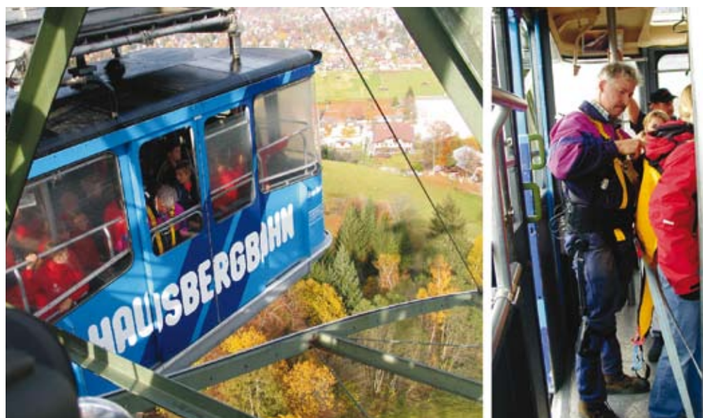
Abbildung 2: Rettung vieler Fahrgäste aus der Großkabine

Auf Grund der mit diesen hohen Kräften einhergehenden Verletzungsgefahren sollten die Handkräfte durch Lastgewichtshandhabung oder andere auftretende relevante Betätigungen bei diesen Rettungs- oder Bergetätigkeiten begrenzt werden. Systematische Lastenhandhabungen, die den Retter oder Berger bis in