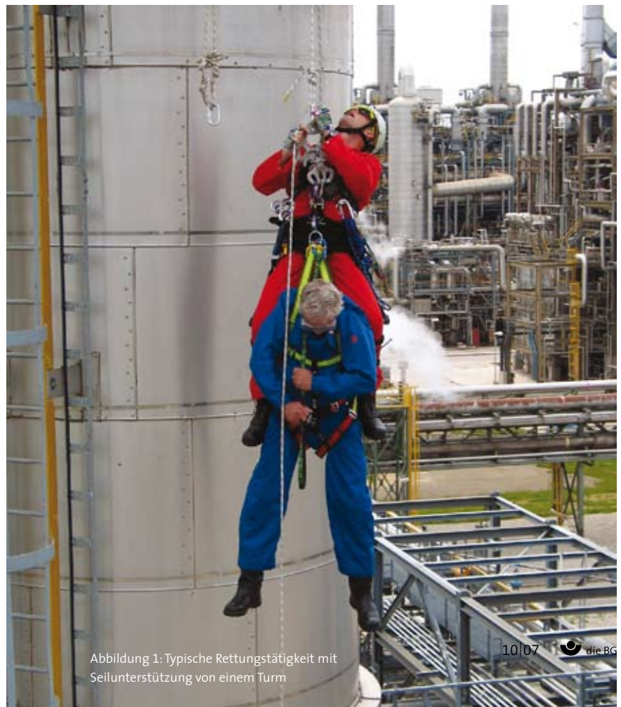
Abbildung 1: Typische Rettungstätigkeit mit Seilunterstützung von einem Turm

Der interdisziplinäre Forschungsansatz umfasste ergonomische, arbeitsmedizinische und psychologische Inhalte und Untersuchungsmethoden. Im Zentrum der ergonomischen Untersuchungen standen die Körperhaltungen und die