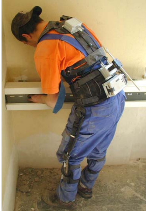
Abb. 1: CUELA-Messsystem

sicheren Befestigung und dem Tragekomfort ein Kompromiss gefunden werden. Die beabsichtigte Dauer der Messung wie auch die körperliche Konstitution der Versuchsperson sind ebenfalls zu berücksichtigen. Die gesamte Masse des in Abb. 1 dargestellten Systems beträgt ungefähr 3 kg.