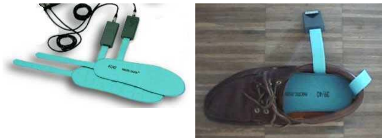
Abb. 2: Messsohlen zur Erfassung der Bodenreaktionskräfte

Die Messsohlen bestehen aus einer Matrize, in die 24 drucksensitive Hydrozellen pro Sohle eingearbeitet sind. Die Messsohlen werden von Größe 23/24 bis Größe 47/48 angeboten.