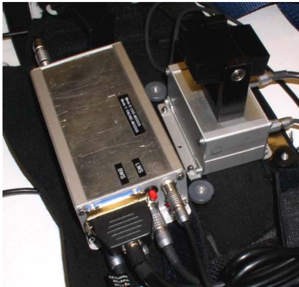
Abb. 3: Datenlogger

zu. Die Signalanbindung der Sensorboxen LWS und BWS an den Datenlogger erfolgt über ein speziell entwickeltes Bus-System. Dadurch ist der Verdrahtungsaufwand erheblich reduziert und ein Vertauschen der Sensorboxen wird durch die automatische Erkennung ausgeschlossen. Die Bedienung des Datenloggers ist denkbar einfach. Ein kombinierter Start/Stopp-Taster genügt, um das CUELA-Messsystem zu bedienen. Vier Status-LEDs zeigen den aktuellen Betriebszustand, z. B. „Boot-Vorgang“, „Messung bereit“, „Messung läuft“ oder „Daten speichern“ an.