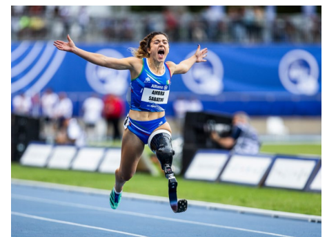
Das Gewinner-Foto „Ein Schrei, ein Sieg“.